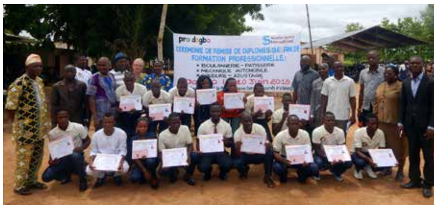
Die feierliche Lossprechung der Lehrlinge im Jahr 2016. Die aktuellen Lehrlinge sind noch mitten in der Ausbildung.

Im Juni 2017 kamen vier Vertreter/innen von ESI aus Benin nach Kleve, um die nächsten Etappen der deutsch-beninischen Kooperation mit dem Vorstand von pro dogbo abzustimmen. Es wurde ein offizieller Kooperationsvertrag zwischen dem deutschen und dem beninischen Verein unterschrieben, der die Verantwortlichkeiten und Pflichten beider Partner für die Zukunft festlegt. Ein langer Weg, aber man geht ihn gemeinsam und immer auf Augenhöhe