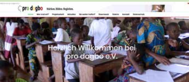
So sieht er aus, der neue Internetauftritt von pro dogbo.